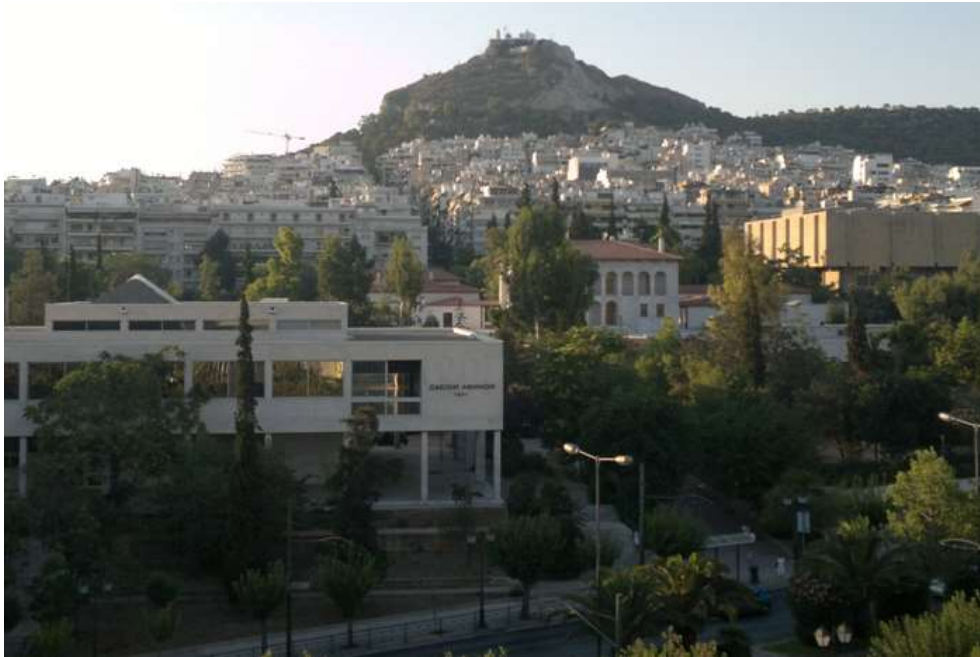
Εικ. 2: Το κτίριο του Ωδείου στην Αθήνα.

Συσχετίζει επομένως το συγκρότημα του πνευματικού κέντρου με την αρχαία ελληνική Αγορά και τη νεοκλασική τριλογία των κτηρίων της οδός πανεπιστημίου. Το σχέδιο ως προς την ανάπτυξή του και τη σχέση του με την πόλη, δανείζεται από τις οικιστικές και τις συνθετικές αρχές των άλλων δύο σχεδίων: μια μεγάλη πλατεία κάθετη στον άξονα της βασιλίσσης Σοφίας που περιέχει τα δημόσια κτίρια πολιτιστικού περιεχομένου. Το Πνευματικό Κέντρο ή η σύγχρονη Αγορά προβάλλει έτσι ως ο πυρήνας της πόλης των Αθηνών της μεταπολεμικής περιόδου, αντάξιος των άλλων δύο του λαμπρού της παρελθόντος.