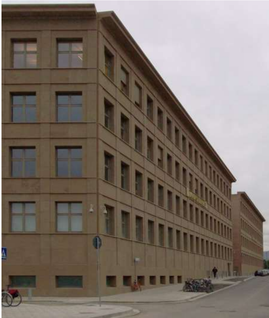
Εικ. 4: Το κτίριο της τράπεζας στη Νόβολη.

Όσον αφορά στην πρόταση του Grassi για την Αθήνα, παρόλο που δεν πραγματοποιήθηκε, φαίνεται να είναι μια από τις πιο συστηματικές απαντήσεις και προτάσεις για το ιστορικό κέντρο, των τελευταίων δεκαετιών. Η πρότασή του βασίζεται στη μελέτη του Κώστα Μπίρη που επεξεργάστηκε ένα σχέδιο αναδιοργάνωσης του ιστορικού κέντρου της Αθήνας και την ίδρυση του Αρχαιολογικού πάρκου, με σκοπό να αποκατασταθεί η συλλογική μνήμη της πόλης και η κοινωνική σημασία των μνημείων της, προσφέροντας ταυτόχρονα μια ευκαιρία για την μελλοντική αστική ανάπτυξη. Η περιοχή του έργου βρίσκεται στον άξονα μεταξύ Κεραμεικού και Ακαδημίας Πλάτωνα με Ίππιο Κολωνό.