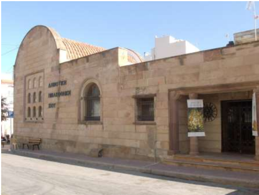
Εικ. 1: Το κτίριο των δημόσιων λουτρών στη Χίο. Σήμερα λειτουργεί ως δημοτική πινακοθήκη.

από την άλλη καταφέρνει ν'αντισταθμίσει ως όγκος τον τρούλο του Οθωμανικού τεμένους στην απέναντι πλευρά της πλατείας.