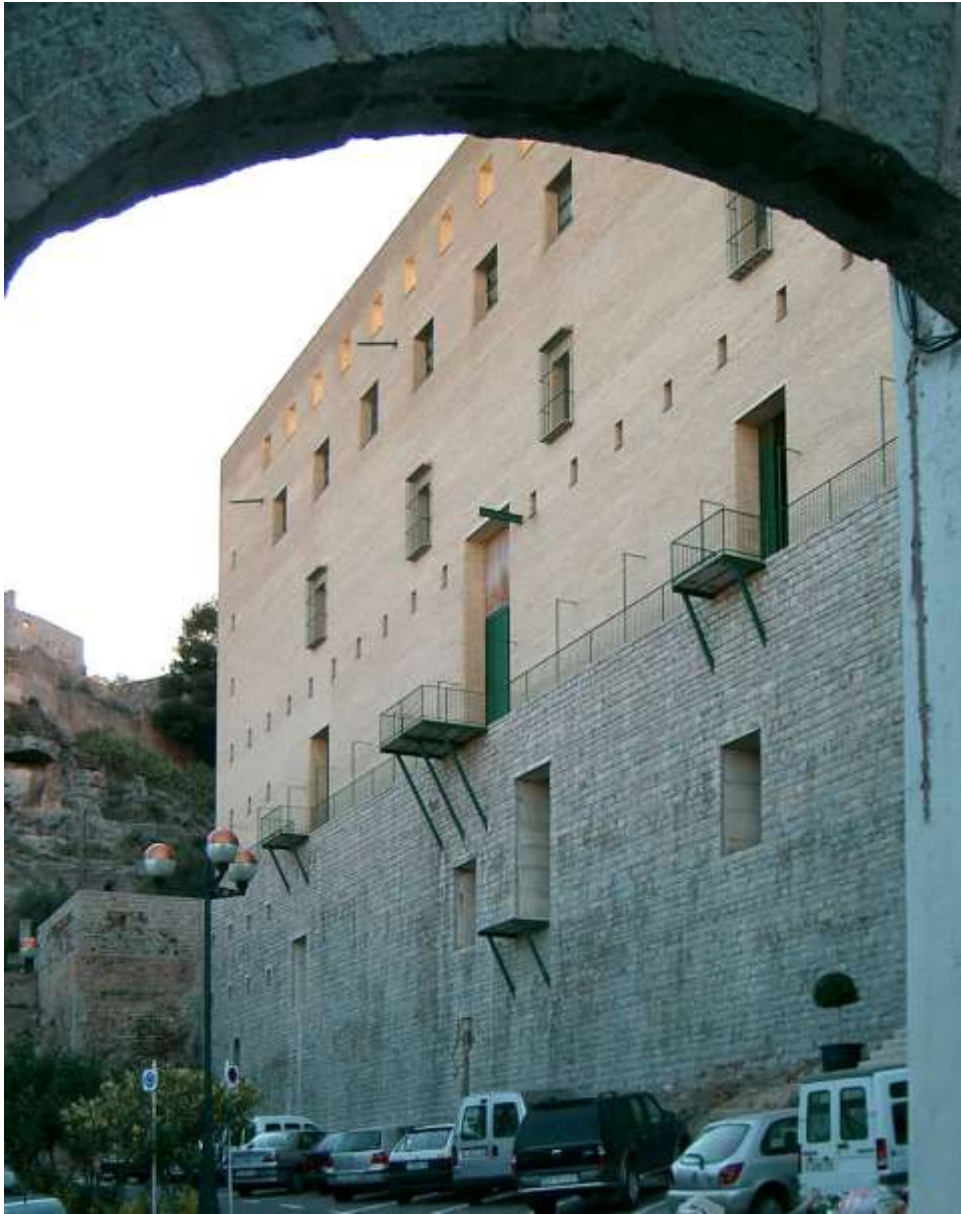
Εικ. 3: Σαγκούντο, Ισπανία. Το μέρος του θεάτρου προς την πόλη.

Το palazzo Rucellai στη Φλωρεντία και το Neue Wache του Schinkel στο Βερολίνο γίνονται οδηγοί αυτή τη φορά για το σχέδιο για τα κτίρια γραφείων στη Νόβολη, ένα προάστιο της Φλωρεντίας. Ο Kenneth Frampton περιγράφοντας το σχέδιο (Frampton, 2009 : 25-29), εξυμνεί τον τρόπο με τον οποίο ο Grassi εκδηλώνει το έντονο ενδιαφέρον του για την δομική έκφραση του κτιρίου χρησιμοποιώντας μια κατασκευή από ενισχυμένο σκυρόδεμα και μεταλλικούς δοκούς, το οποίο επενδύει με τούβλο και πέτρα. Μέσα από μια άσκηση εκφραστικής ειλικρίνειας ο Grassi σχεδιάζει ένα κτίριο που μιμείται τη φέρουσα τοιχοποιία από τούβλα και είναι επενδεδυμένο σε ορισμένα σημεία με πέτρα. Πρόκειται για μια προσπάθεια δραματικής έκφρασης που με κάθε τρόπο θέλει να δείξει ότι ο ψαμμίτης έχει χρησιμοποιηθεί μόνο ως επένδυση. Αυτό επιτυγχάνεται και με τη χρήση του τούβλου που ιστορικά δεν αποτελεί ένα υλικό τελειώματος, αλλά δηλώνει συνήθως το μη ολοκληρωμένο. Η πέτρινη επένδυση έρχεται έτσι να τελειώσει την κατασκευή και με τη χρήση της να καθορίσει επίσης τις διαφορετικές ιεραρχίες των προσόψεων.