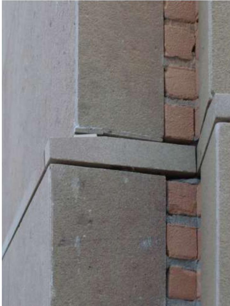
Εικ. 5: Λεπτομέρεια από το κτίριο της τράπεζας στη Νόβολη.